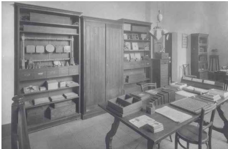
Fig (2) Laboratorio experimental del Grupo Benéfico.

La discrecionalidad con la que se podía actuar en este ámbito de la protección de los menores explica que hubiera pugnas constantes en el seno de las instituciones que conformaban el sistema barcelonés: la Junta Provincial, el TTMB y los centros de internamiento. Estas pugnas trataban sobre temas como el modelo de reeducación de los menores, la forma de organización de las instituciones, la orientación del siempre escaso presupuesto asignado, etc. Al final, el buen o mal funcionamiento del sistema, el buen o mal trato dado a los menores, dependían en gran medida de la persona que estaba al mando de cada una de las instituciones del sistema, y se han podido constatar fuertes oscilaciones al respecto. Se trató, en definitiva, de un laboratorio experimental del que salieron algunos logros, pero también graves fracasos.