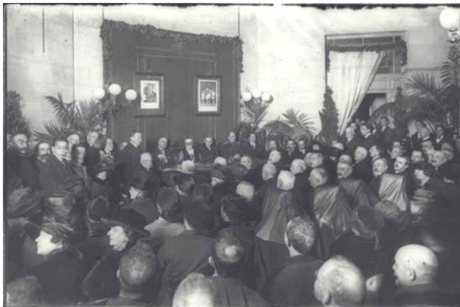
Fig (1) Acto de constitución del TTMB de Barcelona. 11 de febrero de 1921. (Barcelona, Arxiu Nacional de Catalunya, Fondo Brangulí, ANC1-42-N-27915).

Así, respecto a la situación anterior, lo que se logró con la implantación del modelo tutelar fue, por una parte, que los menores dejaran de ingresar en las cárceles de adultos, y, por otra, hacer frente de manera programada y extensa a los gravísimos problemas de pobreza y mendicidad infantil que existían. Sin embargo, diversos autores han señalado el carácter instrumental del sistema con fines bien distintos al meramente asistencial: